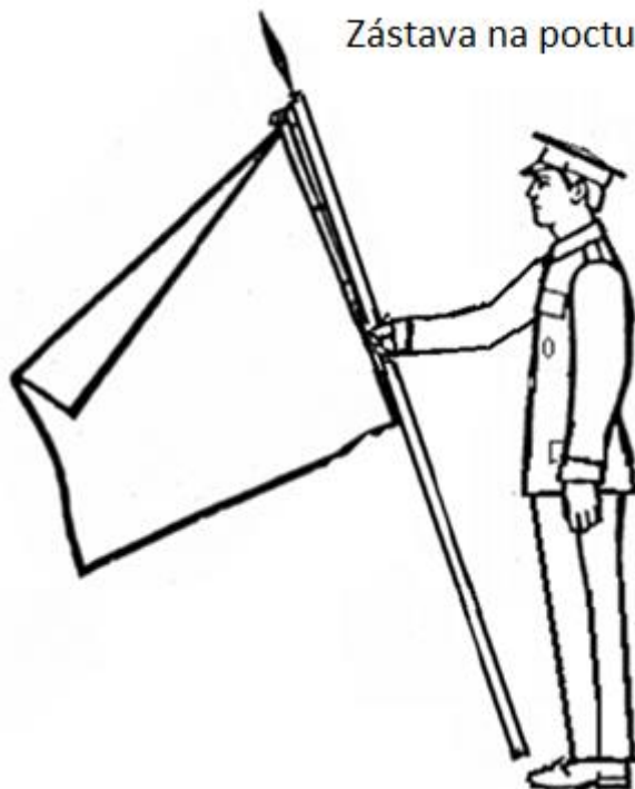
Zástava na poctu